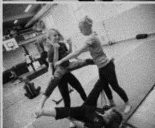
Sirkunstundervisning i Trondheim kommunale kulturskole, høsten 2014.